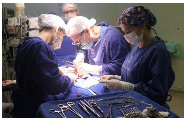
Imagem 47: Cirurgia de transplante renal.