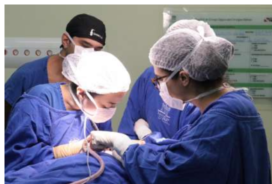
Imagem 11: Mutirão de Cirurgia de Orelha