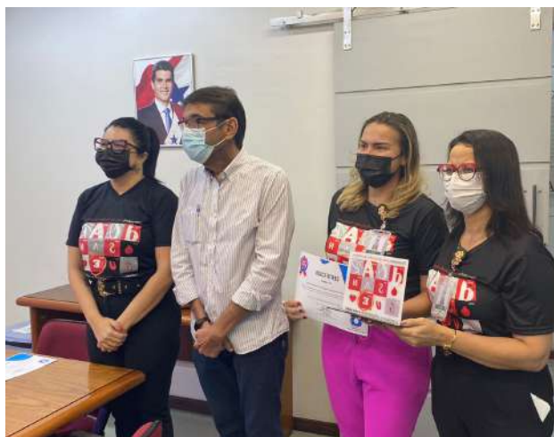
Imagem 41: 1º Lugar na II Gincana Instituição Cidadã da Fundação HEMOPA

"O maior presente é a vida". Projeto "Book da gestante" objetiva eternizar a fase especial da gestação e as emoções que estão se desenvolvendo na vida da mãe e de seus familiares.