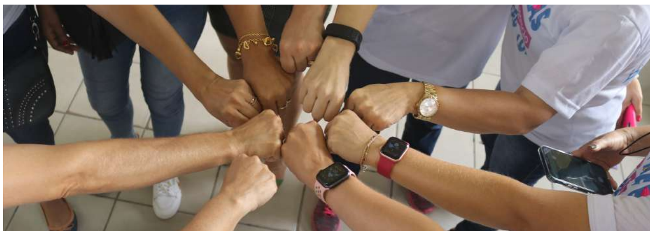
Imagem 49: Projeto de parceria entre FSCMP e PARAPAZ.