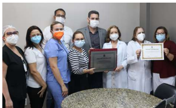
Imagem 34: Recebimento do prêmio Dr. Pinotti

“Tecnologia inovadora salva recém-nascidos de lesões neurológicas”, Fundação Santa Casa utiliza tecnologia inovadora que salva vidas. A técnica de Hipotermia Terapêutica é tratamento inovador, voltado para neuroproteção do bebê.