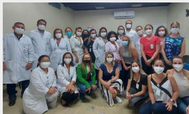
Imagem 23: Visita da equipe do Hospital Albert Einstein

Parcerias pela vida, Fundação Santa Casa/PROADI-SUS/Hospital Albert Einstein fortalecem parceria para redução da morte materna , o objetivo envolve projetos de ciência da melhoria no cuidado, além de segurança e qualidade na assistência prestada às mulheres grávidas.