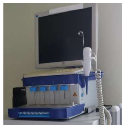
Imagem 14: Tromboelastograma.

Primeiro hospital da região Norte a dispor do aparelho que realiza o exame de tromboelastometria , conhecido como ROTEM, graças a essa nova tecnologia é possível avaliar diferentes aspectos da coagulação, em procedimentos cirúrgicos, fornecendo um guia para a correção dos potenciais distúrbios.