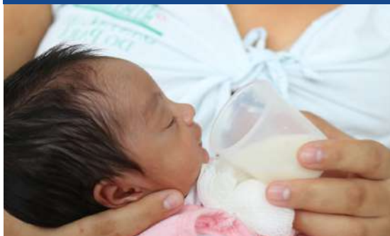
Imagem 8: Recém-nascido em alimentação