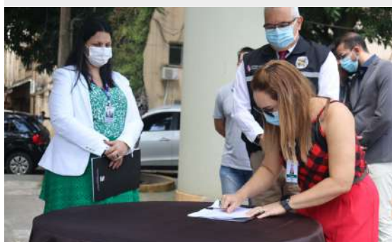
Imagem 20: Assinatura do termo de cooperação técnico/financeira entre a SEAP e FSCMP.

“Oportunidade para todos”, Santa Casa firma termo de cooperação técnico/financeira com a Secretaria de Estado de Administração Penitenciária (SEAP) para ressocialização de internos do sistema penal , essa é uma parceria inédita para oportunizar retorno ao trabalho de oito internos do regime semiaberto do sistema penal.