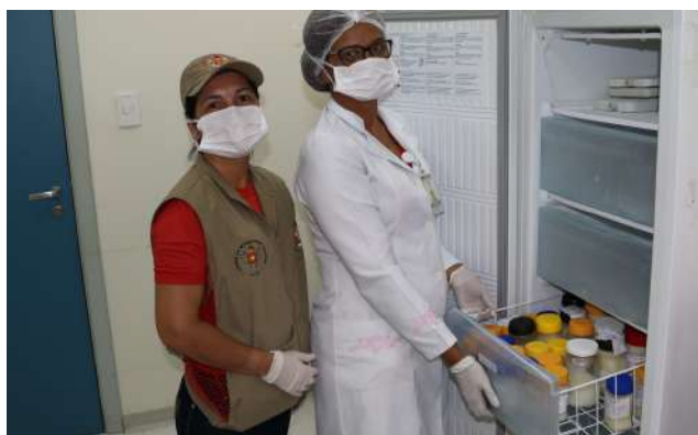
Imagem 1: Estoque do Banco de Leite

“Doar leite materno é um gesto de amor que salva vidas” , em ação permanente a Fundação Santa Casa busca diariamente coletar leite materno, disponibilizando dessa forma alimento saudável e de qualidade aos recém-nascidos, em 2019 foram 3.241 litros de leite humano coletado.