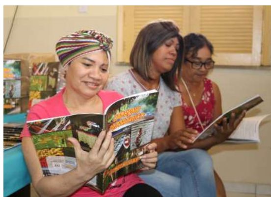
Imagem 6: Vítimas de Escalpelamento no Espaço Acolher

Em 2021 foram atendidas 239 vítimas de escalpelamento, sendo 17 casos novos . A instituição além de oferecer o tratamento de saúde, proporciona também o atendimento no Espaço Acolher , local adaptado para albergar as vítimas e seus familiares, que em geral são pacientes de longa permanência em seu tratamento.