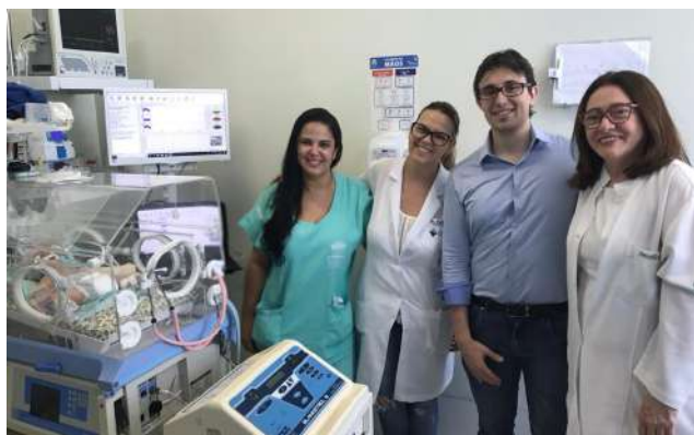
Imagem 13: Primeira UTI Neonatal Neurológica da Região Norte.

Primeiro hospital da região Norte a dispor do aparelho que realiza o exame de tromboelastometria , conhecido como ROTEM, graças a essa nova tecnologia é possível avaliar diferentes aspectos da coagulação, em procedimentos cirúrgicos, fornecendo um guia para a correção dos potenciais distúrbios.