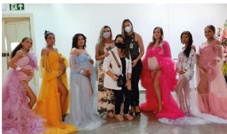
Imagem 42: Projeto "Book da gestante".

"O maior presente é a vida". Projeto "Book da gestante" objetiva eternizar a fase especial da gestação e as emoções que estão se desenvolvendo na vida da mãe e de seus familiares.