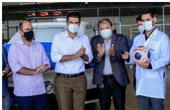
Imagem 33: Recebimento da ambulância

“Hospital show de bola”, Santa Casa recebe doação de ambulância do programa Craques da Saúde. A Confederação Brasileira de Futebol (CBF) em parceria com a Fiat, por meio do programa Craques da Saúde.