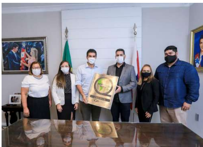
Imagem 32: Entrega da placa de recertificação como ONA II.

“Qualidade e segurança como prioridade”. A direção da Fundação Santa Casa do Pará entregou ao governador Helder Barbalho a placa que recertifica o hospital com o selo de Acreditado Pleno - ONA 2. Após avaliação do Instituto Qualisa de Gestão (IQG) foi constatado a prioridade pela qualidade e segurança dos pacientes, o selo de qualidade representa reconhecimento nacional.