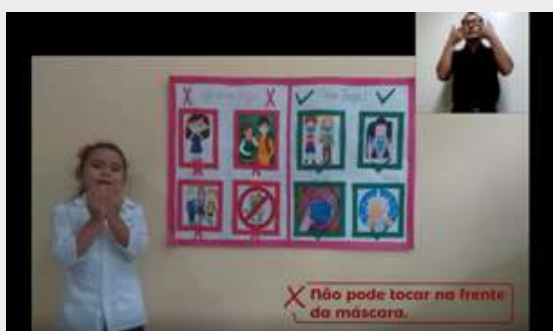
Imagem 16: Vídeo educativo abordando temas relacionados à COVID-19 promovidos pela FSCMP.

Projeto “Santa Casa extra muro” permaneceu mesmo durante a Pandemia, parceria entre a FSCMP e SEDUC que proporcionou ação educativa por meio de vídeos. O conteúdo abordado retrata os cuidados que devemos tomar nesse momento de pandemia. Foi incluído intérprete de libras visando promover a inclusão social.