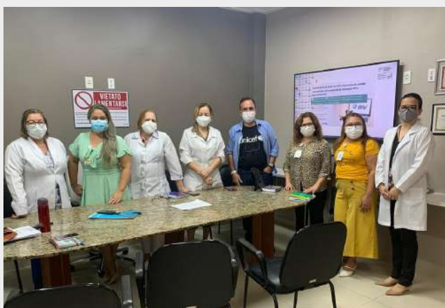
Imagem 29: Parceria FSCMP com a SOPAPE e UNICEF.

Implantação do projeto "10 passos e hábitos para a alimentação saudável do nascimento até os 2 anos de idade" .