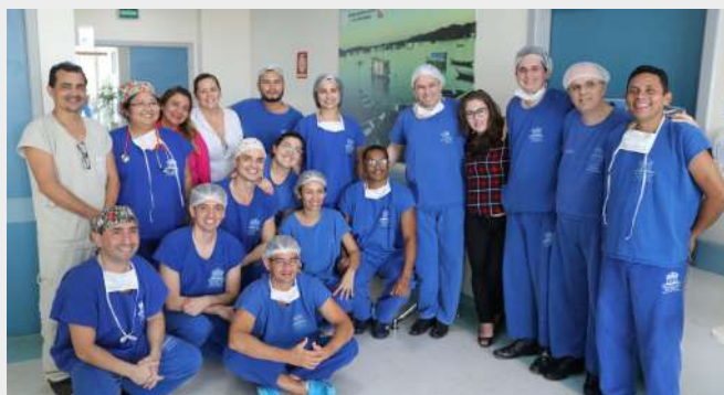
Imagem 9: Mutirão da cirurgia do Pé Torto Congênito

“Toda grande caminhada começa com um simples passo” , a Fundação Santa Casa em parceria com o Centro Integrado de inclusão e Reabilitação (CIIR) beneficiaram mais de 30 crianças com a realização de mutirão de cirurgias do pé torto congênito, que foram realizadas no Centro Cirúrgico da Instituição.