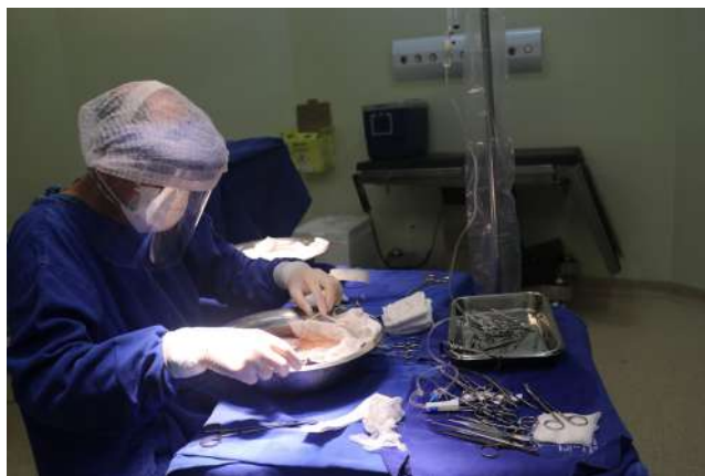
Imagem 37: Rim sendo preparado para o transplante

“O sonho não acabou”, com a retomada do transplante renal pediátrico a Santa Casa realiza 07 transplantes, no mês dedicado à doação de órgãos (setembro verde). As cirurgias beneficiaram pacientes pediátricos portadores de insuficiência renal crônica avançada , atendidos pelo Centro de Referência estadual, que funciona no hospital.