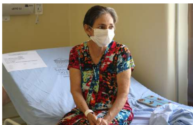
Imagem 39: Paciente na enfermaria.

Primeira cirurgia no fígado por vídeo pelo SUS no Pará. A cirurgia de hepatectomia videolaparoscópica oferece mais controle dos riscos de infecção e pode antecipar a alta em até metade do tempo.