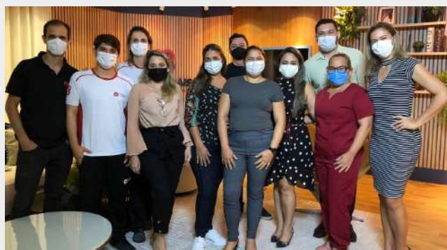
Imagem 28: Parceria FSCMP e Grupo Cynthia Charone

Com o projeto "Aprimorar Enfermagem" , a parceria foi firmada para produção de mídias digitais específicas para capacitações dos enfermeiros, por meio de conteúdos de alta qualidade em EAD.