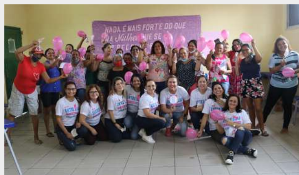
Imagem 27: Projeto "Entre ela abrindo janelas".

Santa Casa em parceria com Fundação PARAPAZ e DEACA inaugura novo espaço de atendimento às crianças e adolescentes vítimas de violência sexual, aumentando sua capacidade de atendimento e proporcionando melhor atendimento aos usuários.