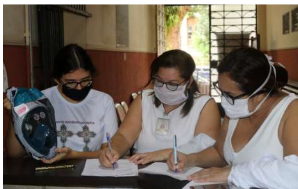
Imagem 18: Recebimento das máscaras de mergulho doadas pelo Coren-PA e pelo grupo Solidários da Saúde Pará.

“Criatividade é a arte de conectar ideias” , para evitar a intubação precoce em pacientes críticos acometidos pela COVID-19, a Fundação Santa Casa de Misericórdia do Pará utilizou máscaras de mergulho para realizar ventilação não invasiva, prática que salvou muitas vidas.