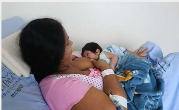
Imagem 22: Amamentação de RN.

Parcerias pela vida, Fundação Santa Casa/PROADI-SUS/Hospital Albert Einstein fortalecem parceria para redução da morte materna , o objetivo envolve projetos de ciência da melhoria no cuidado, além de segurança e qualidade na assistência prestada às mulheres grávidas.