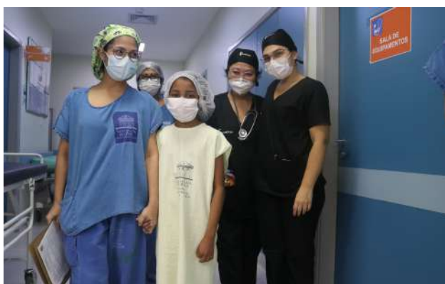
Imagem 46: Equipe do transplante.

No entanto, já proporcionou, em parceria com o hospital Albert Einstein e PROADI-SUS, o treinamento da equipe especializada e a inauguração da primeira enfermaria pública, exclusiva para pacientes com doenças hepáticas na região norte, logo, poderá aumentar o número de transplantes tanto renal quanto hepático no Estado do Pará.