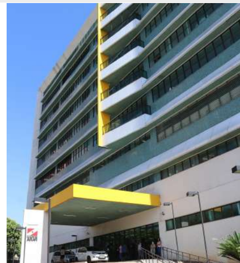
Imagem 1: Unidade Almir Gabriel

Em 2021 a instituição conquistou a recertificação com o selo de Acreditado Pleno – ONA II, onde foi constatada a prioridade pela qualidade e segurança dos pacientes e ainda no mesmo ano, recebeu o prêmio ‘Dr. Pinotti’ , concedido pela Câmara federal dos deputados. A premiação é concedida às instituições que mais se destacaram pela qualidade dos serviços que promovem a Saúde da Mulher. Das 68 Instituições de saúde indicadas ao Prêmio “Dr. Pinotti – Hospital Amigo da Mulher”, a Fundação Santa Casa do Pará foi uma das cinco ganhadoras de todo território nacional.