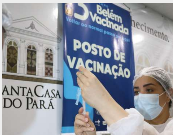
Imagem 31: Registro da campanha de vacinação na FSCMP.

Em parceria foram realizadas campanhas de vacinação da COVID-19 para os colaboradores e residentes da instituição, tanto para a 1º e 2º dose quanto para a dose reforço.