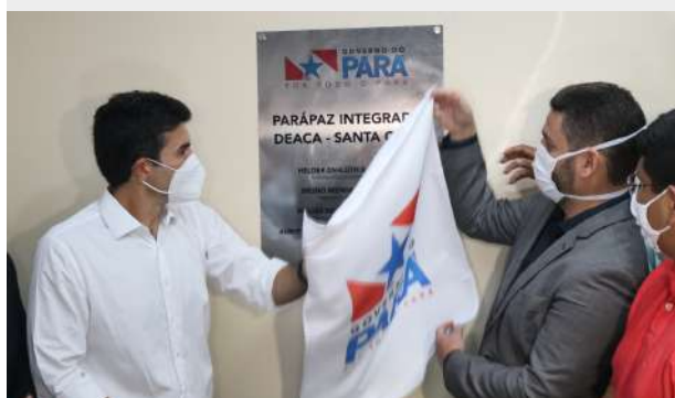
Imagem 26: Inauguração da reforma do PARAPAZ.

Santa Casa em parceria com Fundação PARAPAZ e DEACA inaugura novo espaço de atendimento às crianças e adolescentes vítimas de violência sexual, aumentando sua capacidade de atendimento e proporcionando melhor atendimento aos usuários.