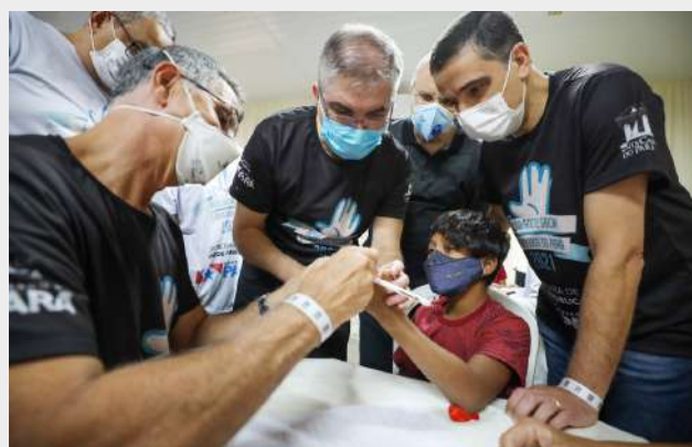
Imagens 25: Multirão de cirurgia das mãos