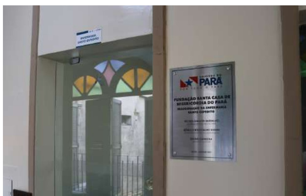
Imagem 38: Entrada da enfermaria.

Pioneirismo no SUS, Fundação Santa Casa inaugurou a primeira enfermaria pública exclusiva para pacientes com doenças hepáticas na região norte, a mesma será destinada para pacientes com patologias diversas no fígado e aqueles que se submeterem a cirurgia de transplante.