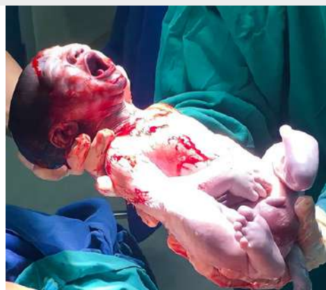
Imagem 3: Recém nascido

➤ O tempo de espera para Acolhimento de Classificação e Risco neste serviço, obteve a média de 5.75 minutos, tempo menor que o estabelecido pelo Ministério da Saúde.