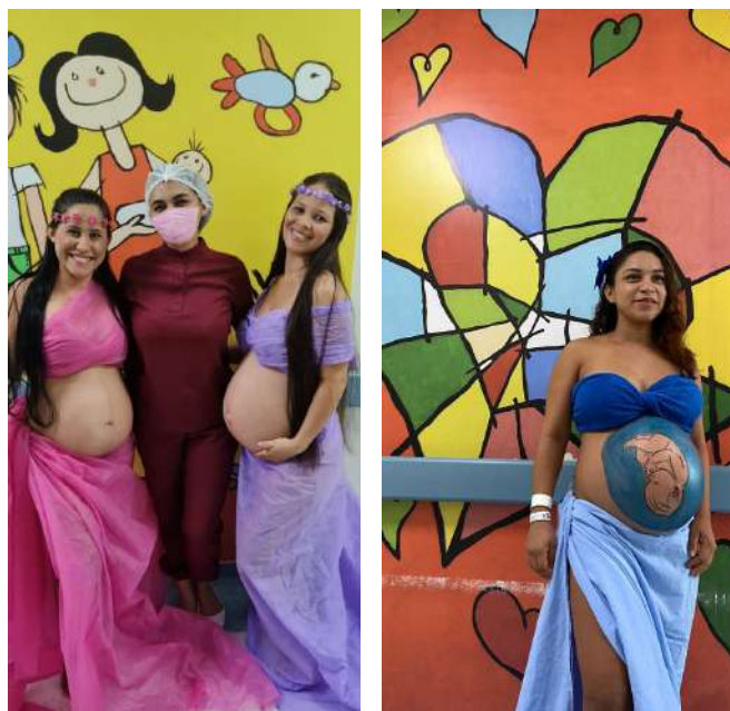
Imagem 4: Participantes do Projeto "Book da Gestante".

Considerando que a gestação é um momento especial para a gestante e sua família, a FSCMP criou em 2021 o projeto "Book da Gestante" , com o objetivo de registrar e eternizar esta fase tão especial, uma vez que as emoções estão se desenvolvendo tornando este momento mágico. As fotografias permitem que a mulher possa reviver os bons momentos e lembrar dos detalhes do período gestacional.