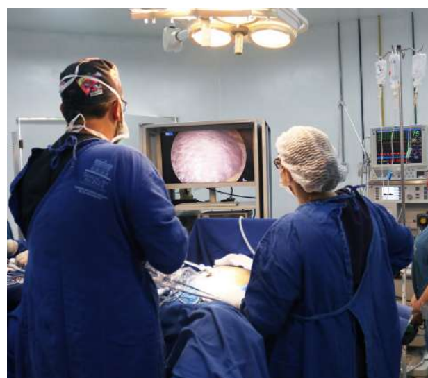
Imagem 40: Hepatectomia Videolaparoscópica.

Primeira cirurgia no fígado por vídeo pelo SUS no Pará. A cirurgia de hepatectomia videolaparoscópica oferece mais controle dos riscos de infecção e pode antecipar a alta em até metade do tempo.