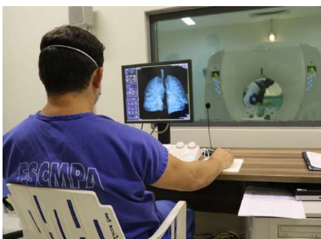
Imagem 36: Novo Tomógrafo

Novo tomógrafo de tecnologia avançada entra em funcionamento na Santa Casa. A aquisição da tecnologia faz parte de um processo de modernização do parque de imagem , iniciado em 2020, e auxiliará no diagnóstico de casos suspeitos de COVID-19.