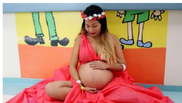
Imagem 5: Participante do Projeto "Book da Gestante".