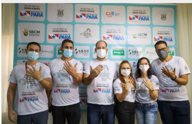
Imagens 24: Multirão de cirurgia das mãos

Em ação inédita na região Norte, Santa Casa realiza ação social de cirurgia em crianças com grave deformidades nas mãos . Promovida pela Sociedade Brasileira de Cirurgia da Mão (SBCM) dentro dos blocos cirúrgicos da Santa Casa e com o apoio dos profissionais do Hospital, a ação social reuniu um especialista internacional, 10 especialistas de outros estados, 10 especialistas paraenses e 10 residentes.