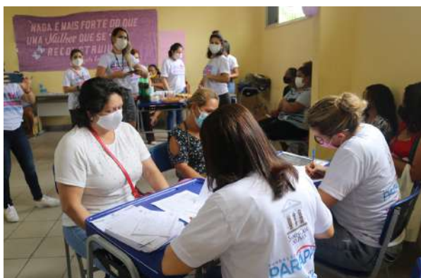
Imagem 48: Projeto de parceria entre FSCMP e PARAPAZ.

O serviço é composto por uma equipe de médicos, peritos, psicólogos, assistentes sociais, enfermeiros e a DEACA (Serviço especializado de atendimento a crianças e adolescentes) oferecendo num único espaço todos os profissionais necessários ao atendimento da criança e adolescente vítima de violência sexual.