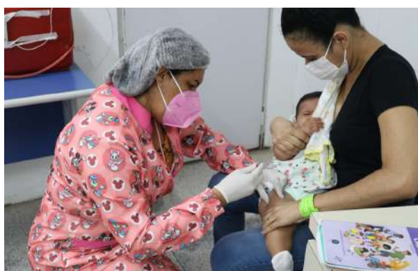
Imagem 44: Trabalho do CRIE.

Neste ano de 2021, a instituição retomou a reforma da Casa da gestante, bebê e puérpera , atualmente com 20% da obra concluída e finalizou a primeira etapa da obra do ambulatório de pediatria faltando apenas aquisição de mobiliários e equipamentos, o referido prédio vai oferecer atendimento em consultas de pediatria, atendimento especializado em fissura labio palatal e anomalias crânio faciais, o serviço do CRIE (Centro de Referência de Imunobiológicos) , além do programa método canguru .