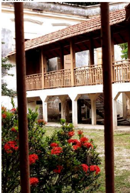
Imagem 2: Corredor da capela do Hospital Centenário

A FSCMP possui em média 2.945 servidores. Além disso, conta com uma capacidade instalada de 513 leitos, dos quais 486 em operação, divididos na Unidade Almir Gabriel (UAG) e Hospital Centenário (HC), destes, 70 leitos foram habilitados em 2021 para atendimento exclusivo dos pacientes com a COVID-19, sendo 40 leitos de UTI Adulto/COVID-19 e 30 leitos de UTI Pediátrico/COVID-19 , obteve incentivo financeiro do Ministério da Saúde via estado do Pará com disponibilidade orçamentária no valor total de R$ 27.104.955,40 (vinte e sete milhões, cento e quatro mil, novecentos e cinquenta e cinco reais e quarenta centavos). No referido ano foram notificados o total de 1.952 casos de COVID-19, sendo 78% em pacientes do sexo feminino e 22% do sexo masculino, com relação aos resultados dos exames foram confirmados 688 casos por critérios laboratoriais, clínico e por imagem.