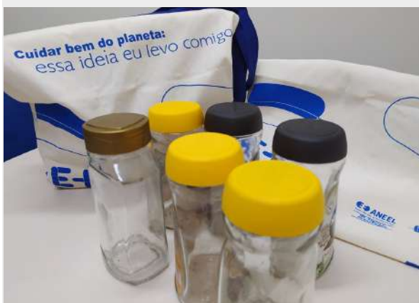
Imagem 30: Frascos arrecadados frutos da parceria.

Foi assinado um inédito termo de cooperação técnica para ampliar a arrecadação dos frascos que comportam leite materno doado.