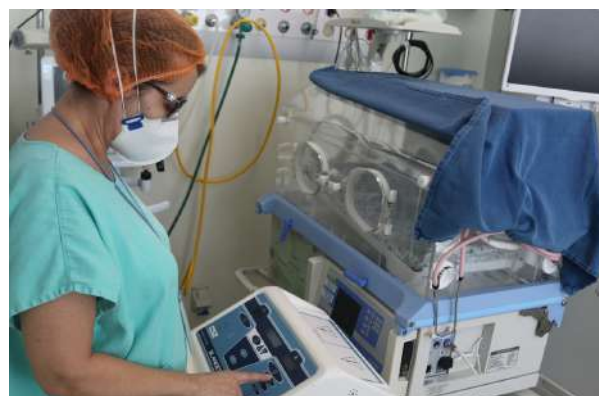
Imagem 35: Equipamento de Hipotermia Terapêutica.

“Tecnologia inovadora salva recém-nascidos de lesões neurológicas”, Fundação Santa Casa utiliza tecnologia inovadora que salva vidas. A técnica de Hipotermia Terapêutica é tratamento inovador, voltado para neuroproteção do bebê.