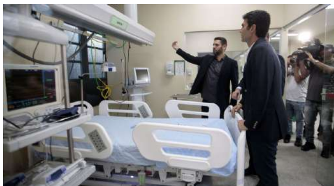
Imagem 12: Inauguração da UTI adulto

A Fundação Santa Casa amplia oferta de serviços à comunidade paraense, em 2019 com a habilitação de 20 novos leitos de UTI, sendo 10 leitos de UTI pediátrica e 10 leitos de UTI adulto os quais foram disponibilizados à regulação do Estado, com o intuito de aumentar a oferta de leitos e serviços para a Rede de Atenção à Saúde (RAS).