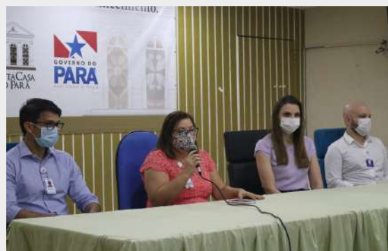
Imagem 21: Evento do projeto “Cuidados Paliativos”

Fundação Santa Casa/PROADI-SUS/Hospital Sírio-Libanês firmaram parceria para o projeto “Cuidados Paliativos” , essa ação tem por objetivo prestar atendimento humanizado e com segurança a todos os pacientes.