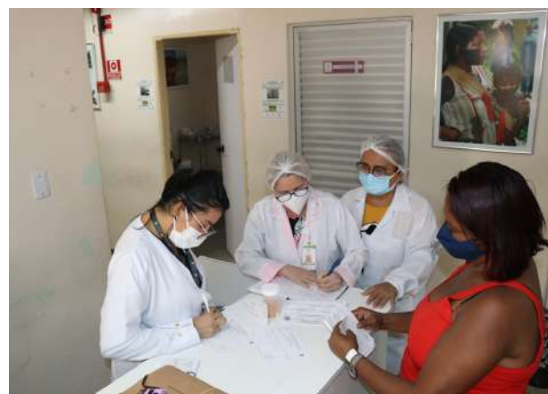
Imagem 45: Atendimento no ambulatório da mulher.

Também, destaca-se o ambulatório da mulher, com execução de 20% da reforma concluída, realizou 18.978 atendimentos o que evidencia a importância dessas obras para melhorias e benefícios dos usuários do SUS.